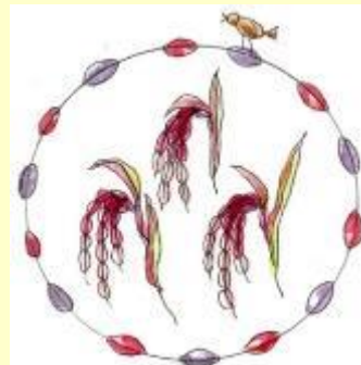
代かき・泥んこ遊び・生き物探し 脱穀・もみすり(昔の道具)