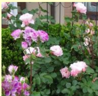
シェエラガードとダフネ つるバラの剪定・誘引