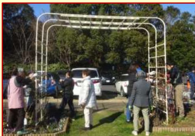
つるバラ（桜霞）シェエラガードとダフネの剪定 みんなでアーチのつるバラの剪定・誘引